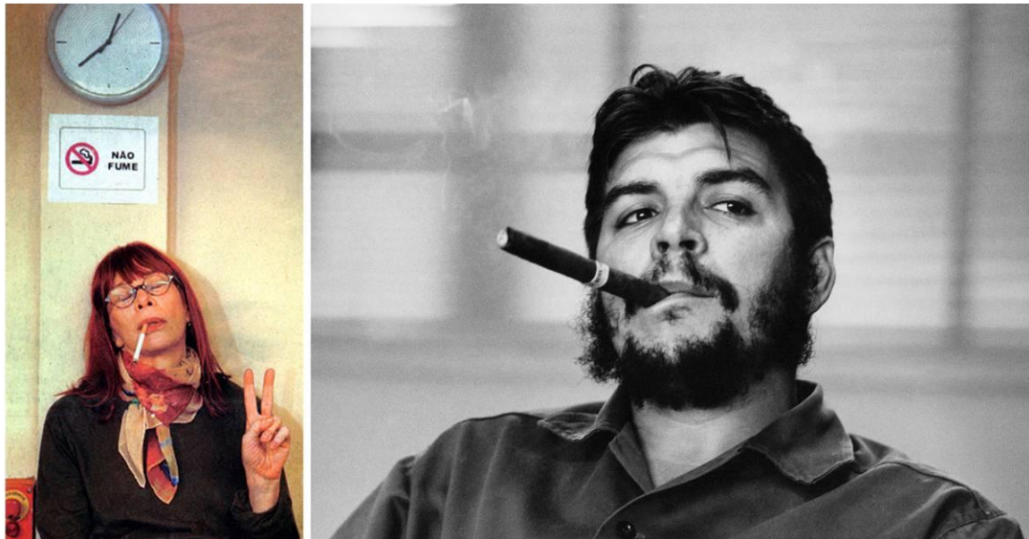
FIGURA 4: Rita Lee e Che Guevara.

Ao contrapor-se o carácter rebelde constituído na imagem de Rita Lee à expressão de rebeldia presente na imagem de Che Guevara 7 (Figura 4), percebem-se as diferentes formas que o mesmo ethos pode assumir na cena enunciativa.