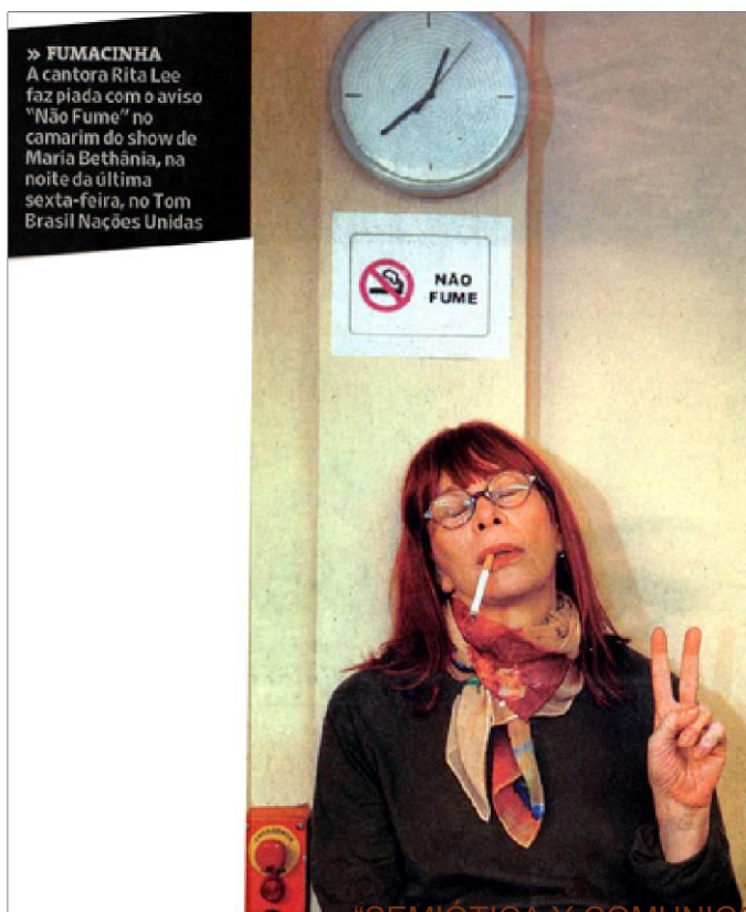
FIGURA 1: Rita Lee em camarim de show.

Os ponteiros do relógio indicam vinte minutos para a uma hora da manhã. Abaixo do relógio, vê-se o que aparenta ser uma folha comum de papel sulfite colada na parede, e, nela, dois signos de tamanhos semelhantes, um verbal e outro não-verbal, com a informação redundante de ser proibido o uso de cigarros.