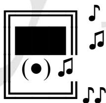
Imagen 10. Arte en Face . Símbolos que asemejan un reproductor digital de música (iPod). 7